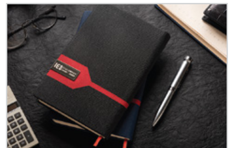
301 هلیا - قطع اروپایی بزرگ داخله : روزانه | جلد : چرم مصنوعی نوع کاغذ : کرم اندونزی | Size: 21/5 x 14 رنگ جلد : مشکی، سرمه ای ● ● قیمت با کرم اندونزی : ۴۷/۰۰۰ تومان قیمت با داخله سفید : ۴۶/۰۰۰ تومان