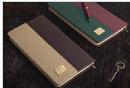
211 نکیسا - قطع اروپایی نوع داخله : روزانه | نوع جلد : چرم مصنوعی نوع کاغذ : کرم اندونزی | Size: 22 x 12 رنگ جلد : قهوه ای، زرشکی ● ● ● قیمت با داخله کرم اندونزی : ۴۱/۰۰۰ تومان قیمت با داخله سفید : ۳۸/۱۰۰ تومان