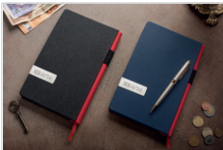
303 شانلی - قطع اروپایی بزرگ داخله : روزانه | جلد : چرم مصنوعی نوع کاغذ : کرم اندونزی | Size: 21/5 x 14 رنگ جلد : مشکی | سرمه ای ● ● قیمت با کرم اندونزی : ۴۸/۵۰۰ تومان قیمت با داخله سفید : ۴۷/۵۰۰ تومان