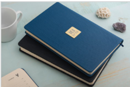
300 الیا - قطع اروپایی بزرگ داخله : روزانه | جلد : چرم مصنوعی نوع کاغذ : کرم اندونزی | Size: 21/5 x 14 رنگ جلد : مشکی، آبی ● ● قیمت با کرم اندونزی : ۴۵/۷۰۰ تومان قیمت با داخله سفید : ۴۴/۷۰۰ تومان