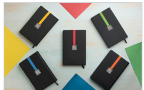
304 مهرداد - قطع اروپایی بزرگ داخله : روزانه | جلد : چرم مصنوعی نوع کاغذ : سفید | Size: 21/5 x 14 رنگ جلد: مشکی با ۵ رنگ نوار ● | لبرنگ هم رنگ نوار قیمت با داخله سفید : ۴۹/۷۰۰ تومان قیمت با کرم اندونزی : ۵۰/۷۰۰ تومان