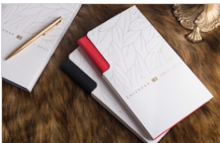
700 کاور سررسید نوع : مقوایی ابعاد : وزیری 17 x 24 | اروپایی بزرگ 14 x 21/5 | اروپایی 12 x 22 قیمت سایز وزیری : ۴/۰۰۰ تومان قیمت سایز اروپایی بزرگ : ۳/۵۰۰ تومان قیمت سایز اروپایی کوچک : ۳/۰۰۰ تومان