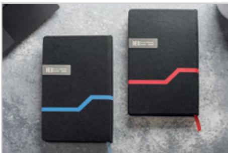
302 داوین - قطع اروپایی بزرگ داخله : روزانه | جلد : چرم مصنوعی نوع کاغذ : کرم اندونزی | Size: 21/5 x 14 رنگ جلد : مشکی با دو رنگ نوار ● قیمت با کرم اندونزی : ۴۶/۹۰۰ تومان قیمت با داخله سفید : ۴۵/۹۰۰ تومان