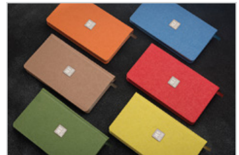
210 ثمین - قطع اروپایی نوع داخله : روزانه | نوع جلد : پلی وینیل نوع کاغذ : کرم اندونزی | Size: 22 x 12 رنگ جلد: نارنجی، زرد، سبز، قرمز، آبی، نسکافه ای ● ● ● ● ● قیمت با داخله کرم اندونزی : ۳۸/۸۰۰ تومان قیمت با داخله سفید : ۳۵/۹۰۰ تومان