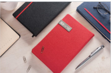
305 یونا - قطع اروپایی بزرگ داخله : هفتگی دستیار | جلد : چرم مصنوعی نوع کاغذ : کرم اندونزی | Size: 21/5 x 14 رنگ جلد : مشکی، قرمز، سرمه ای ● ● ● قیمت با کرم اندونزی : ۳۸/۴۰۰ تومان قیمت با داخله سفید : ۳۷/۸۰۰ تومان